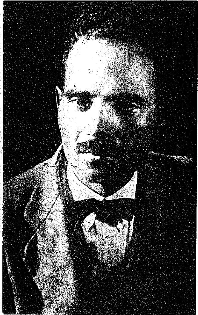
DON PEDRO ALBIZU CAMPOS

Este gran revolucionario y símbolo de valor y sacrificio patriótico muere el 21 de abril de 1965 prácticamente en manos de nuestro enemigo. La histórica resistencia de los que por la patria luchan nos indica el camino hacia la victoria. No muy lejos está el día en que nuestra bandera orgullosamente ondee sola en una patria libre y socialista gracias a todos aquellos que como el Maestro Albizu Campos hacen su decisión de luchar.