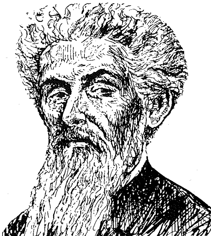
Ramón Emeterio Betances, líder de la insurrección armada de Lares, gran patriota y intelectual. Dedicó su vida al bienestar de nuestro pueblo.

En 1864 regresó Betances a Puerto Rico para poner en práctica estas ideas. Dos años más tarde es exiliado nuevamente junto a Ruiz Belvis sin posibilidades de regreso alguno. Desde la isla de Santo Domingo, Betances junto a otros líderes radicales puertorriqueños planeó la estrategia para lograr la independencia de Puerto Rico. Esta acción tuvo su culminación en el 1868, año en que se proclamó la