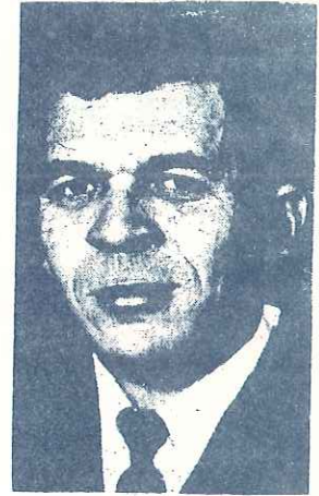
Rafael Cancel Miranda